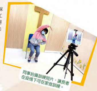
同事拍攝訓練短片，讓長者在疫情下可在家做訓練。

相信疫情並不能在短期內消失，如何在疫情下建立新常態的服務，持續提昇長者的身體及精神健康，減低疫情對長者的影響，會是中心來年設計服務的焦點。