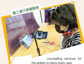
counselling services for the elderly is rising every year.

本會兩間自負盈虧中心以配合地區需要而發展特別服務計劃，翠樂長者睦鄰中心開展「長者社區照顧服務券」服務，提供「中心為本照顧服務」及「中心及家居混合模式照顧服務」。此外，「宣健護長物理治療服務」成功申請香港公益金資助，繼續服務東區長者，讓他們能獲得低收費及適時的物理治療服務。海