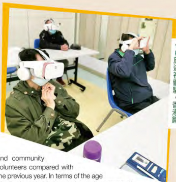
VR旅遊初體驗·香港篇

In 2020-2021, we served 5,237 elderly members, 206 needy carers, 852 carers, 966 elderly volunteers and 207 community volunteers. The number of elderly members and needy carers had increased by less than 3%. In comparison, the number of carers had increased significantly this year by 27%, which was believed that an increase in individual care and support under the COVID-19 pandemic provided us more opportunities to serve carers. However, most elderly volunteering services were suspended due to the epidemic, resulting in a significant decrease in the number of elderly