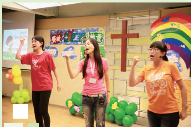
演員透過話劇帶出正能量訊息（「發放正能量」嘉年華）