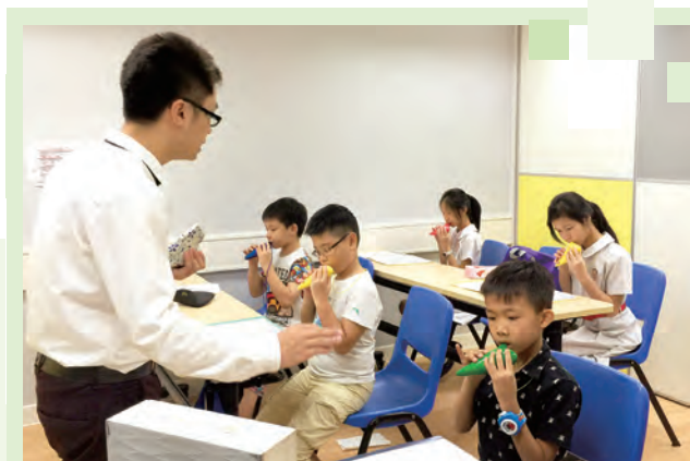
「Be Yourself • Be A Star」音樂培訓計劃的學員專心學習陶笛