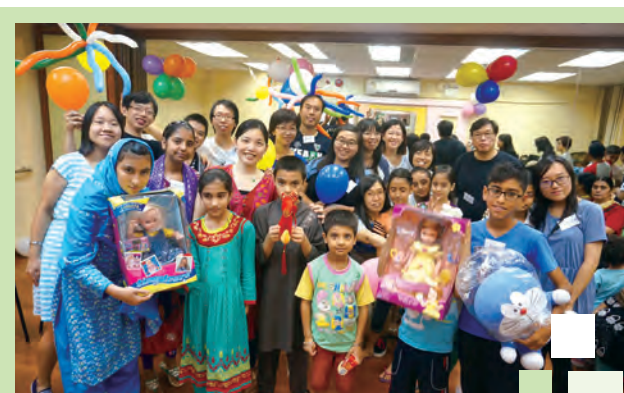
南亞義工隊與參加者一同參與暑期結業派對