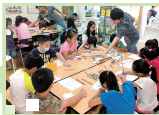
『小腳趾Run Run Run』暑期聖經班