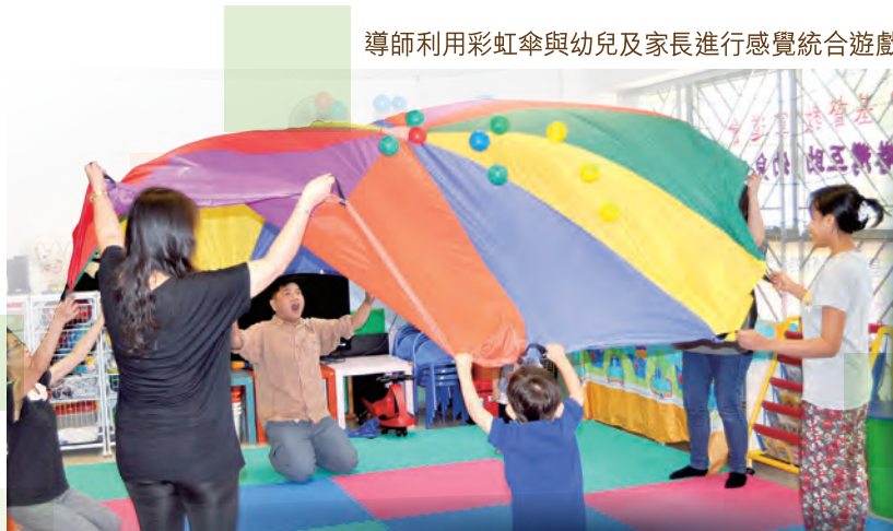
導師利用彩虹傘與幼兒及家長進行感覺統合遊戲