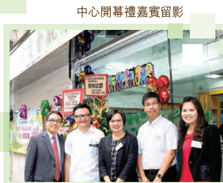
中心開幕禮嘉賓留影