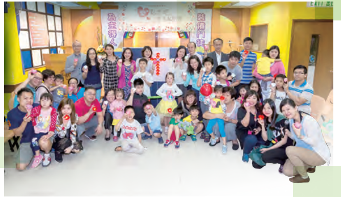
愛點燃會員起動禮