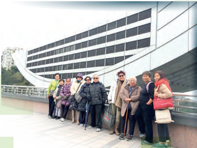
活力耆兵自在遊 - 長者亦可以四處旅行