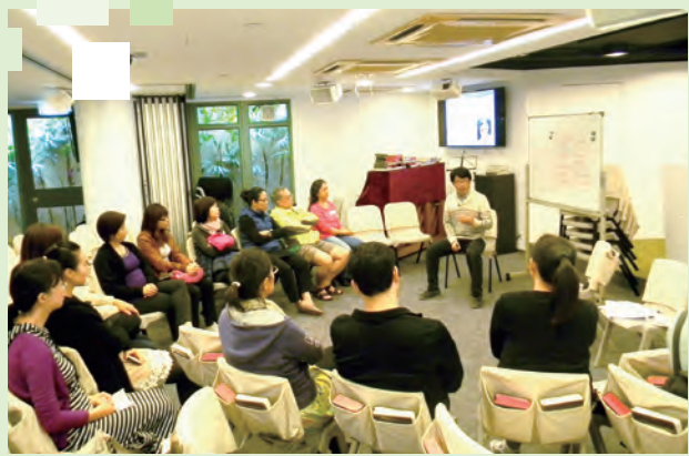
家長教育講座 - 為家長提供管教分享平台