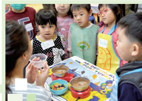
繽紛「蛋」「朱」日 - 導師向幼兒講解如何製作鮮果朱古力寶盒