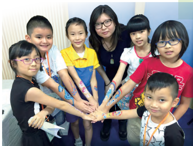
「2015夏日珍寶Crew」暑期託管，專業彩繪師與學童分享夢想盼望。