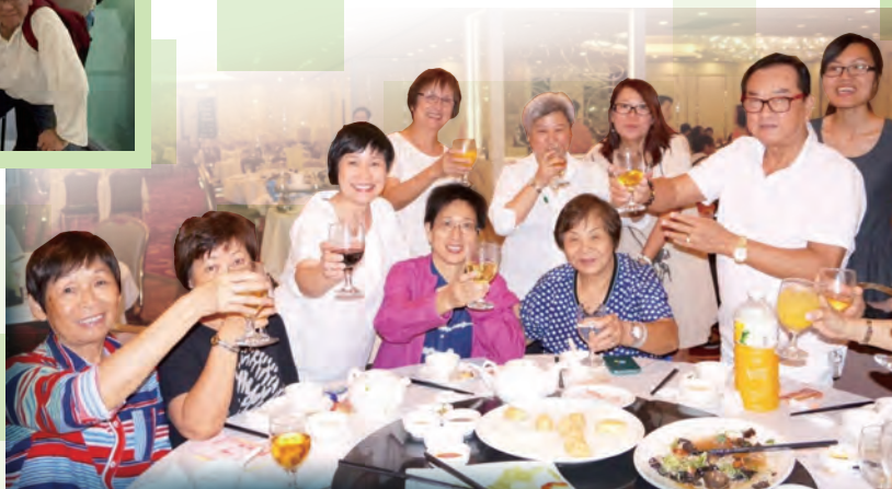
參與多年的粵曲組組員，彼此間已建構出一份默契