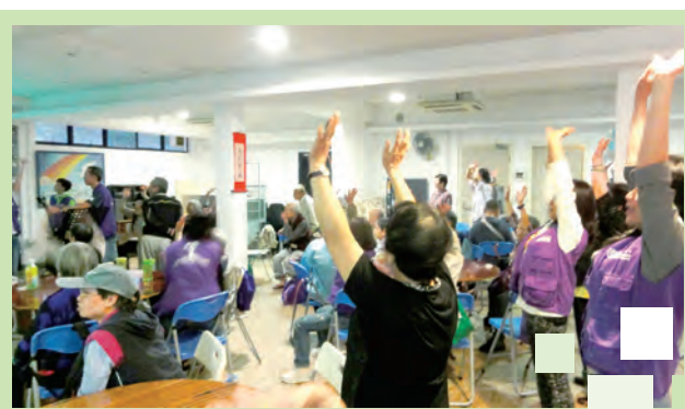
中心義工與教會弟兄姊妹服侍無家者