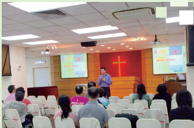
「請別再叫我加油」家長講座