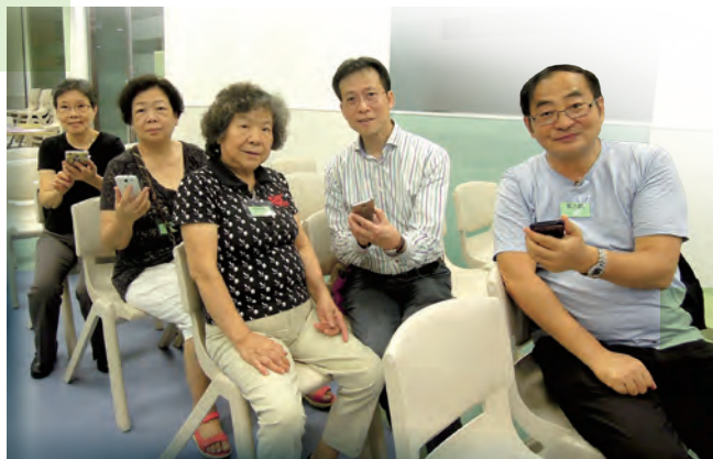
學員與時並進，學習運用智能手機（樂齡天地）