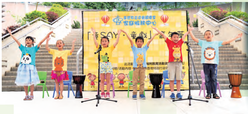
孩子們於嘉年華會落力的演出